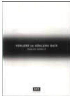
Yerlere ve Göklere Dair Osman Serhat Erkekli C Yayınları

9.Dünya Kitap Şiir Ödülü Dünya Yayıncılık